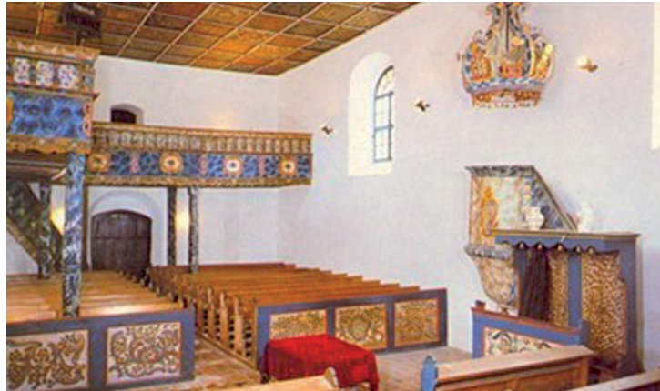
3. Abbildung: Reformierte Kirche in Drávaiványi