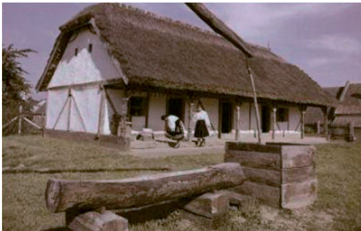
4. Abbildung: Zerrbalkenhaus (Talpasház) in Sellye

Einer Volkszählung zufolge waren die Häuser in 1697 im Dorf Rétfalu, das heute zu Osijek gehört,