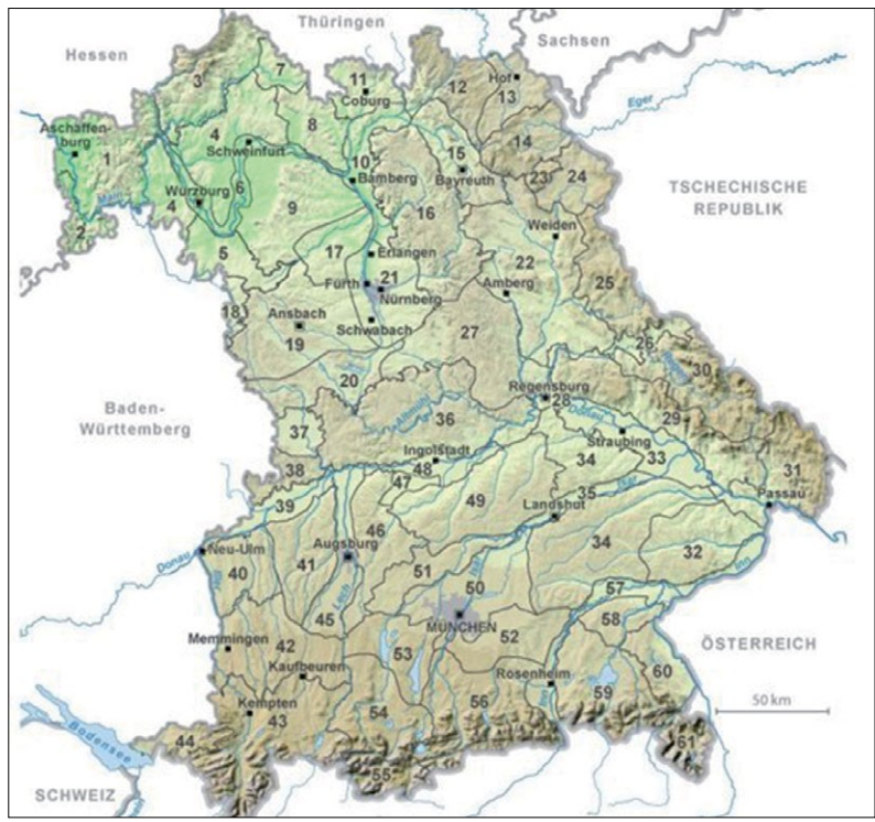
2. Abbildung: Kulturlandschaftsklassifizierung des gesamten Bundeslandes Bayern 2. Figure: Classification of Cultural Landscapes in the Entire State of Bavaria

Das Ergebnis ist in Abbildung 2 auf der interaktiven Karte auf der Website des Bayerischen Landesamtes für Umwelt zu sehen, die für jedermann zugänglich ist und bei einem Klick auf einen der 61 Kulturlandschaftsräume die dahinter liegenden bedeutenden Kulturlandschaften offenbart. Die obige Klassifizierung ist kein Ersatz für die Klassifizierung von Naturlandschaften, sondern vielmehr eine notwendige Ergänzung dazu. Phase I des Projekts wurde im Juni 2009 abgeschlossen.