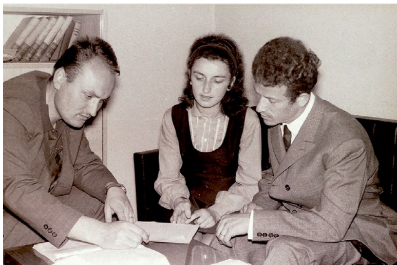
Slika 1. U novinarskim danima, kao prvi urednik sa suradnicima, odmah nakon osnivanja Radio Čakovca