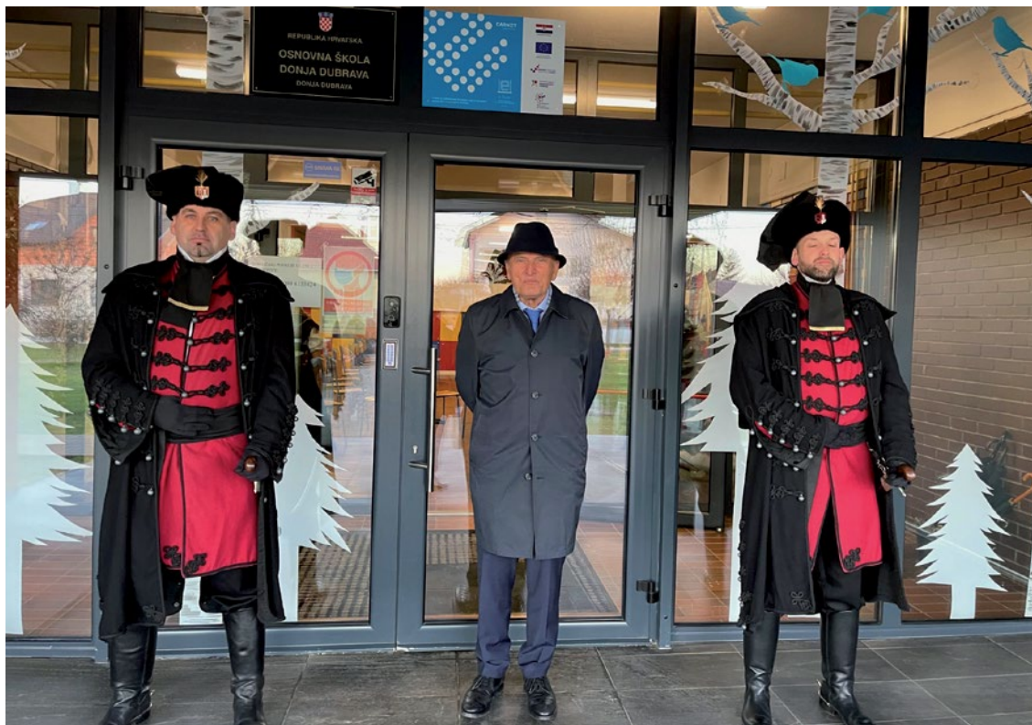
Slika 6. Ispred škole u Donjoj Dubravi s pripadnicima Zrinske garde

mi je industrijska geografija specijalnost. Među njima su mi najdraže one najobilnije i metodološki najbolje postavljene, a to je svakako monografija Podravke (još iz osamdesetih godina), pa onda i MTČ i druge koje ste spomenuli. Obradio sam uglavnom međimurska i podravska poduzeća, no napisao sam i povijest tekstilne industrije u Zaboku, dijela metalne industrije u Zagrebu i druge, čak i drvne industrije u Novskoj. Dakle, ipak sam obrađivao i šire područje od sjeverozapadne Hrvatske.