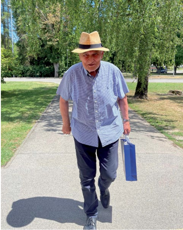
Slika 11. Na povratku u svoj koprivnički dom