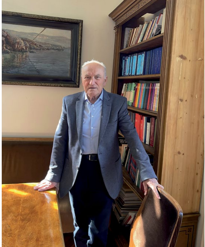
Slika 7. U prostorijama I. razreda za društvene znanosti HAZU