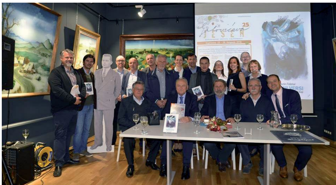
Slika 9. S obitelji i prijateljima u Koprivnici

Meridijani u stvari žive na entuzijizmu, naprosto zato što je informatika preuzela ulogu knjiga. Knjige se danas vrlo teško izdaju, gotovo nemoguće, a literatura jedino može opstati uz podršku (pogotovo stručna znanstvena literatura, jer mi svi plaćamo proračun). Državi mora biti stalo da znanstvena i stručna dostignuća budu ukoričena u knjigama jer će tako najdulje opstati. Tako će se najracionalnije, najbolje koristiti za napredak. Jako je teško izdavati knjige. U Hrvatskoj smo negdje potkraj prošlog stoljeća imali i više od 1600 izdavačkih kuća. Sad je taj broj spao na oko 300, a od toga je samo nekoliko doista aktivnih. Slično je s knjižarama, one su sve faktički propale. Naime, knjige se više ne kupuju. Knjižare su se orijentirale na prodaju ostale papirnate ili druge robe, dok im knjige služe samo za ukras na nekoj maloj polici. Tako da je to doista vrlo težak i stresan posao, ali mi se ne damo. U Meridijanima i dalje radimo i izdajemo i zadovoljni smo time što smo u ovim uvjetima uspjeli napraviti.