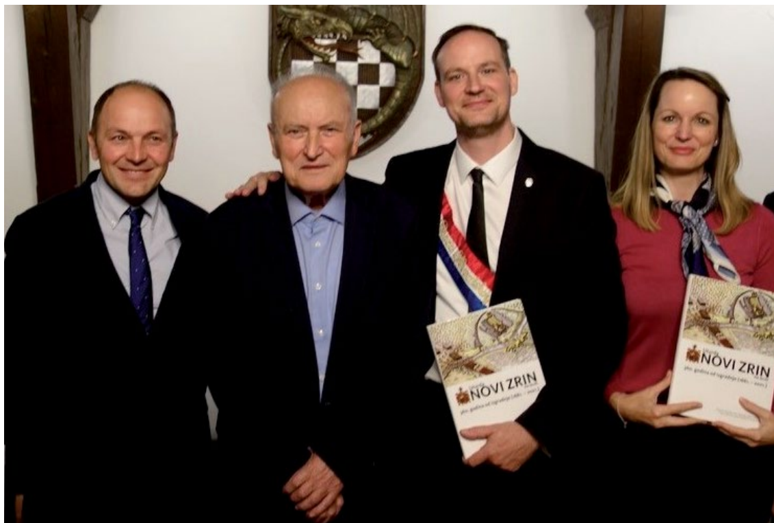
Slika 8. U zmajskoj kuli nad Kamenitim vratima s kćeri i sinom

stjecajem okolnosti, baš jedne moje knjižice (izašla je prije nekoliko dana) Povijest splavarstva na rijeci Dravi , objavili smo 252 knjige. Izdali smo, dakle, više od 250 naslova knjiga, oko 80 naslova udžbenika, a sigurno i pedesetak svezaka znanstvenih časopisa; izdajemo i dva znanstvena časopisa: Podravina (izašao je 35. broj) i Ekonomska i ekohistorija (to je vrlo dobar međunarodni znanstveni časopis). Dakle, izdali smo pedesetak svezaka znanstvenih časopisa i naravno više od 200 brojeva časopisa Meridijani - tako da se ta bibliografija približila na 600 primjeraka raznih knjiga, časopisa i znanstvenih časopisa.