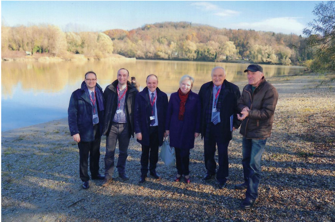
Slika 7. Mednarodna konferenca: Povijest rijeke Drave – poveznice među regijama , Koprivnica (2016)

disciplinarnim pristopom pri proučevanju vplivov in medsebojne povezanosti razvoja strukture prebivalstva in gospodarskih procesov v geografskem prostoru je razvijal tudi metode dela demogeografije, predvsem na področju medsebojne povezanosti naravnogeografskih in demogeografskih procesov, kar se odraža v njegovih člankih in knjigah proučevanja regionalne geografije in gospodarske zgodovine.