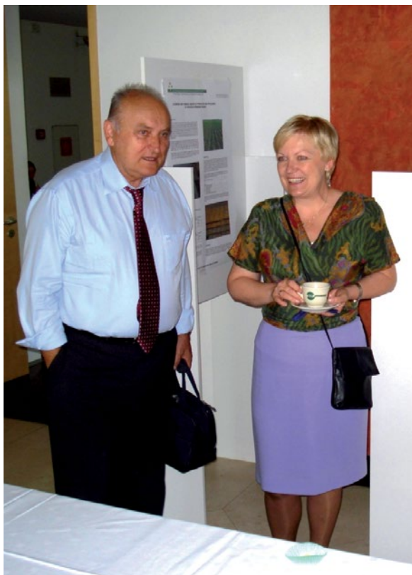
Slika 4. in 5. 17. mednarodna konferenca IGU – CSRS, Maribor 2009.