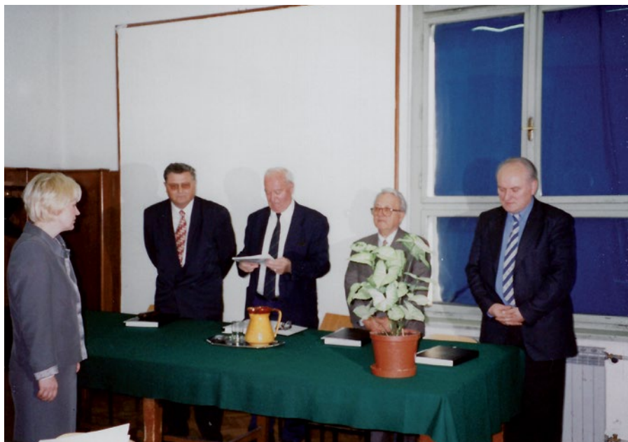
Slika 1. Zagovor doktorata, PMF, Zagreb, 1999

(2007). Opravljao je zahtevna dela. Bil je dekan PMF-a, član Senata i Rektorskoga kolegija Sveučilišta v Zagrebu, predsjednik Zveze geografskih društava Hrvatske in urednik časopisa Geografski glasnik . Na Geografskem odsjeku je razvil vrsto kolegijev: Industrijska geografija, Geografske osnove statistike, Uvod u geografiju, Geografija Afrike i Industrija u prostornom planiranju. Bil je tudi gostujoči profesor na univerzah v Budimpešti, Peči, Lodžu, Ostravi, Göttingenu, Münchnu, Ljubljani, Skopju, Beogradu, Sarajevu in Mariboru. Feletar je bil avtoriteta, ki je bil s svojim delom vzor generacijam študentov.