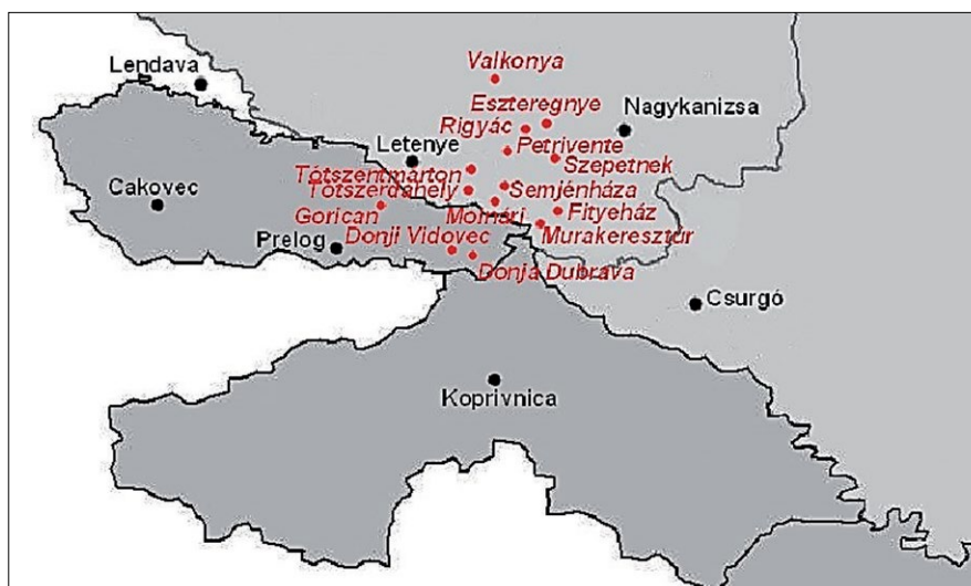
Abb 2. Mura Region EGTC

Aus der Bewertung der Bewerbungsaktivität im IPA-Programm konnten wir den meisten Schlussfolgerungen über den Wechselwirkungen ziehen mit denen wir – außerhalb der historischen Aspekte – die Begründung der Gründung der Organisation über die historischen Aspekte hinaus rechtfertigen können. Es war unsere einzige authentische Quelle, die eine detaillierte Datenbank über Beziehungen hatte. Der kroatisch-ungarischen Industrie- und Handelskammer, die seit mehreren Jahren tätig ist und Büros in beiden Ländern hat, liegen keine ausreichenden Daten zu bilateralen gegenseitigen Investitionen vor. Deshalb haben uns auf die IPA-Programmdaten verlassen (GULYÁS L.- BALI L. 2013).