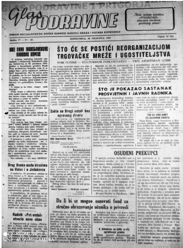
Glas Podravine, IV/29, 19. prosinca 1953. godine

su opustošene sve prodavaonice prehrambenim proizvodima i kućnim potrepštinama. Već je u idućem broju naglašeno da je »šačica paničara« među građanima tvrdila da »neće biti ni soli, ni šibica, ni petroleja, čak ni toalet papira«, a da nestašica zapravo »ne postoji niti će postojati«. Nepovjerljivi građani, kojima je rat bio u živom sjećanju, u samo dva su dana, međutim, kupili »oko 15 vagona soli«, neki »i po 500 kilograma« tog ključnog artikla, kao i ama baš svega što je moglo čemu poslužiti u razdoblju duljih nestašica. Neke su trgovine u toj pomami prestale i prodavati robu kojom su raspolagale pa je problem dodatno eskalirao. Trgovci su zbog toga opomenuti da bi mogli zaraditi i kaznu »do godinu dana zatvora«, a poimenično su nabrajani i građani koji su kupovali više od obiteljskih potreba. Posebno im je zapao za oko »mljekar Šestak«, koji se zbog šerca tek vratio iz zatvora. 123 Za tu su paniku i histeriju morali biti krivi svi osim same gradske vlasti.