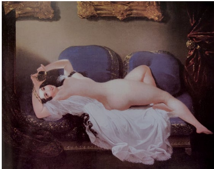
SI 3. Mihael Stroy, Europa, 1836. godine, ulje na platnu, 79 x 116 cm, Dvor Trakošćan, inv. br. DT 1016

Trakošćanski je dvorac, baš kao i Franzensburg, stilskim restauriranjem integrirao antikvitete, inventar i umjetnička djela, preuzeta iz Klenovnika. Oslikane tapete s motivom smotre postrojbe , naslikane za Klenovnik između 1775. i 1760. godine i Tapete s prizorima života običnih građana , nastale u drugoj polovini 18. stoljeća prekrejone su, preslikane te preselejene u Trakošćan. Translatirane su i slike, poput Malog rodoslovlja iz 1775. godine te Četrdesetak portreta časnika (portreti nastali između 1755. i 1760. godine). Unatoč činjenici što su spomenute umjetnine premještene prije promjene vlasništva nad Klenovnikom, inicijativu je moguće sagledati kao translaciju