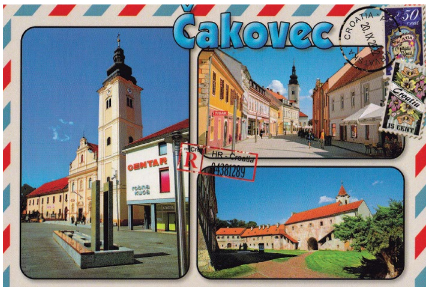
Sl. 2. Crkva sv. Nikole čest je motiv iz kulturno-povijesne cjeline grada Čakovca (2017.)