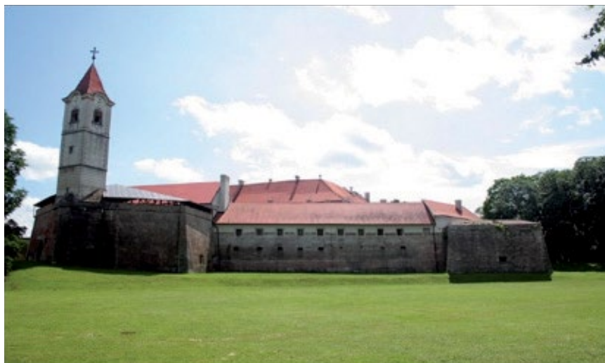
Sl. 1. Fortifikacija Staroga grada (2017.)