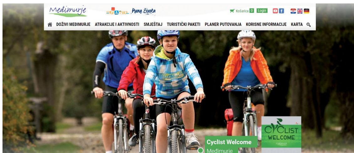
Sl. 5. Internetska stranica TZ Međimurske županije (izvor: Visit Međimurje (25. 9.2017.))

Početkom listopada 2017. godine analizirana je prezentacija kulturne baštine na internetskim stranicama svih turističkih zajednica koje djeluju na području Međimurja (TZ Međimurske županije, Čakovca, Sv. Martina na Muri, Preloga, Štrigove, Murskog Središća i Nedelišća). Analizirani sadržaj prisutan je na šest internetskih stranica, a obuhvaća ukupno 1995 fotografija i 436 članaka. Najuređenija i najpreglednija s najviše analiziranih fotografija i članaka je internetska stranica TZ Međimurske županije (sl. 5).