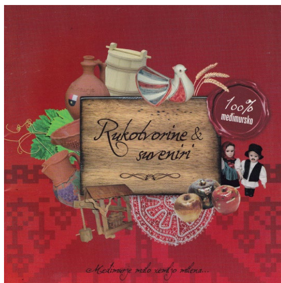
Sl. 4. Međimurske rukotvorine i suveniri u brošuri