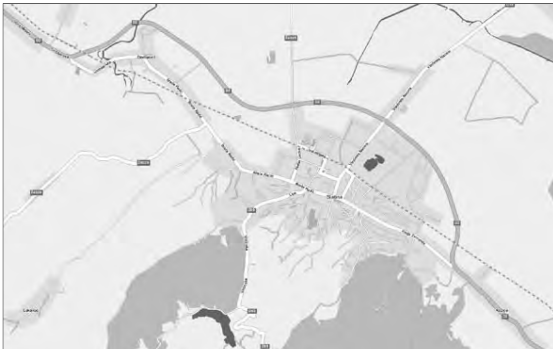
Slika 2. Karta prometnica s novom obilaznicom Grada Slatine (D-2)

Razina opremljenosti koridora tih cesta je različita, tako da je u zoni sjeverno od stare trase državne ceste D-2 uglavnom širina koridora zadovoljavajuća, i u njega je moguće smjestiti sve potrebne prometne površine, kao i vodove komunalne infrastrukture.