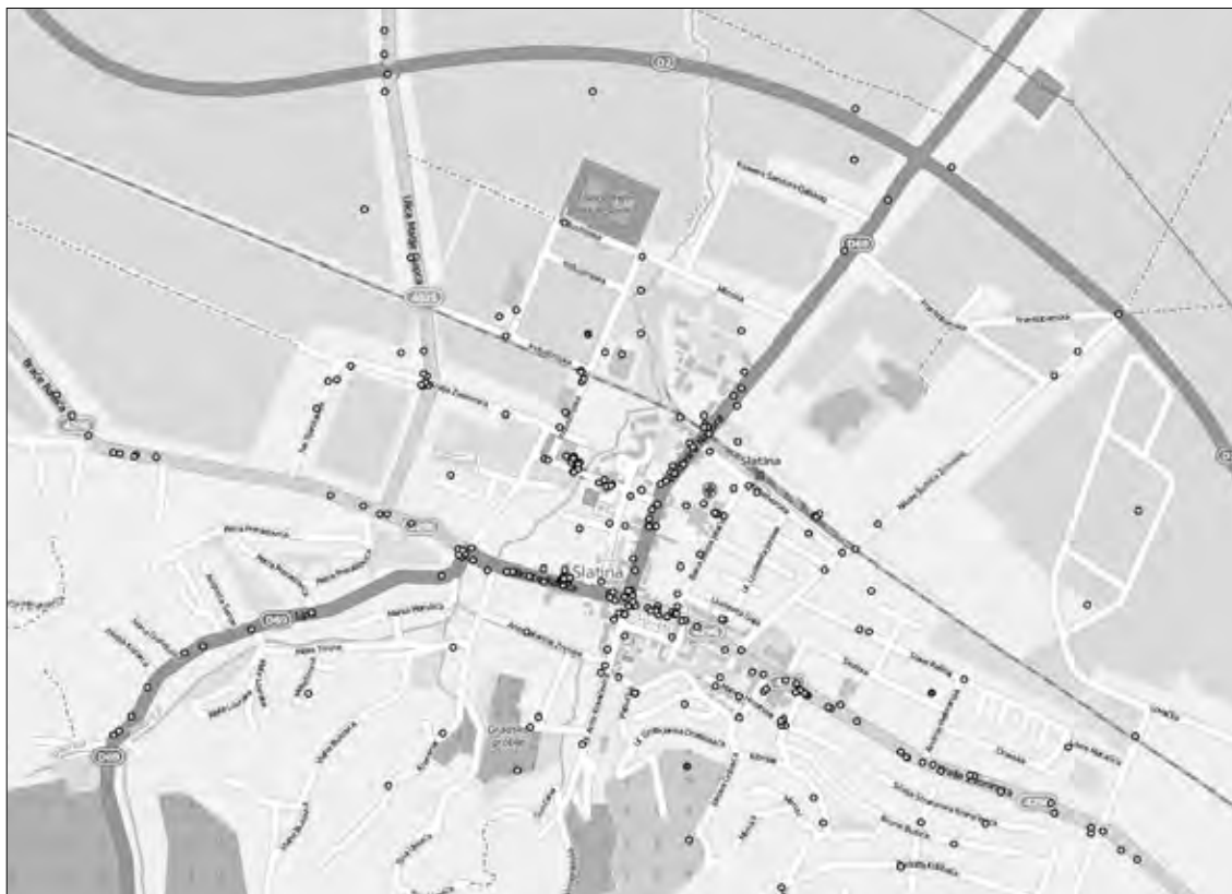
Slika 3 Prikaz analiziranih prometnih nesreća u Gradu Slatini od 2010. do 2013. godine

Može se zaključiti kako su najčešće nesreće po tipu na promatranom području bočni sudari (22,1 posto nesreća), slijetanje vozila s ceste (17,8 posto nesreća), udar vozila u parkirano vozilo (14,8 posto nesreća), te tip nesreće vožnja u slijedu (10,4 posto nesreća). Svi ostali tipovi nesreća čine od 8,25 do tek 0,73 posto svih nesreća.