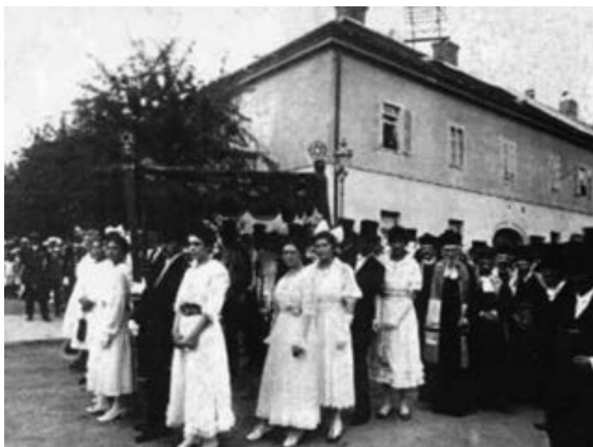
Slika 3. Prijenos Tore iz staroga u novi hram 1917 (Medar)