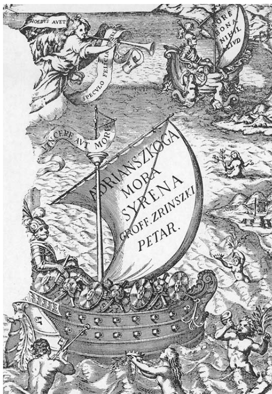
Slika 3: Naslovnica knjige Petra Zrinskog “Adrianszokoga mora syrena”

Dakako, najbrojnija i najutjecajnija djela i zapise o Zrinskim i Frankopanima i njihovu