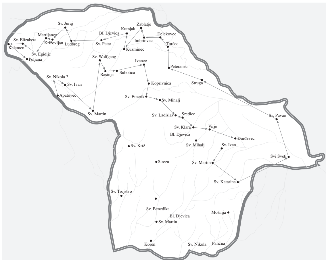
Karta 3: Redoslijed obilaska crkvenih objekata u Podravini tijekom popisivanja 1615. godine

Uzeo je sve župe koje imaju neku topografsku oznaku i dodao još dvije samo s titularom. Razlozi za takav odabir nisu mi jasni. I tu je prenio pogreške iz starog popisa pa piše “Zezuricza” za “Chesuricha”, a što je zapravo Česmica. Kod čitanja popisa iz 1334. godine vizitator ima teškoća s odgonetavanjem imena mjesta pa čita “Obecz” umjesto “Soboch”, “Dizka” za “Descha” i “Dimicza” za “Ruuicha”, što nas može dovesti do zaključka da je riječ o nekim novim župama. U slučaju Đelekovca nije jasno je li prvo pogrešno čitao “Getinoucz” pa onda u tome prepoznao to selo i zapisao “nunc Gielekoucz” ili je “Getinoucz” ipak bilo drugo ime za Đelekovec koje nije potvrđeno u dokumentima.