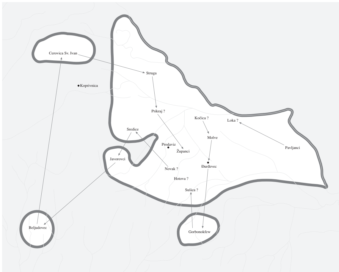
Karta 4: Redoslijed nabiranja dijelova (vesnikata) đurđevečkog vlastelinstva pri popisivanju 1439. godine

varoši, dvije utvrde i 88 sela. U odnosu na prethodni veliki popis iz 1439. godine vidi se povećanje za dvadesetak naselja, ali desetak sela iz prijašnjeg popisa sada nema. Razlozi za novopopisana sela i izostanak nekih starih naselja ne mogu za sada objasniti.